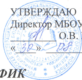
ГРАФИК классных родительских собраний на 1 полугодие 2023 - 2024 учебный год